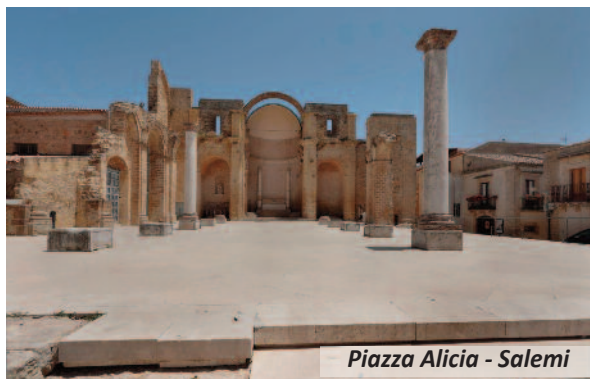
Piazza Alicia - Salemi

trerà in gioco martedì 26 luglio, sempre nell'ambito della Settimana delle Culture, fino a sabato 30: il castello ospiterà a partire dalle 17.30 il 'CineKim 2022', cinque pomeriggi di festival del cinema organizzati in collaborazione con l'associazione Cuncuma. Si tratta del primo Festival del Cinema nato nell'ambito della collaborazione con l'imprenditore coreano Kim, che nel 2009 donò la propria collezione di film in VHS e DVD. Da mercoledì 27 a sabato 30, sempre al castello, il 'Saliber Fest', festival del libro organizzato dall'associazione 'Liber...!'. Restano da definire, invece, le due date della rassegna teatrale itinerante Festival Dionisiache di Segesta: il Comune di Salemi è in attesa della comunicazione delle date da parte del Parco archeologico.