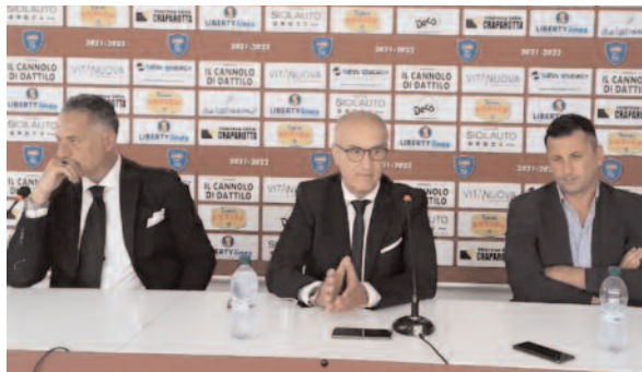
Un momento della conferenza stampa di ieri

La Rosa, ovviamente, s'è soffermato sugli aspetti societari: "Dobbiamo creare una società forte, seria, puntuale, affidabile. Ritengo che il connubio tra una tifoseria appassionata e una società composta da persone