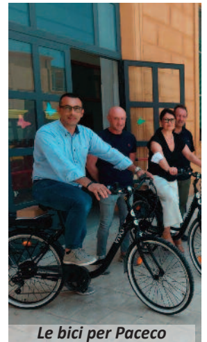
Le bici per Paceco

soddisfazione per "un altro passo compiuto per rendere Paceco sempre più green, dopo la redazione del Piano di Azione per le Energie sostenibili ed il Clima e gli interventi di efficientamento energetico nel territorio.