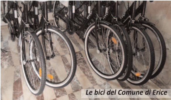
Le bici del Comune di Erice

Gli istituti sono il "Giovanni XXII" di Paceco e il "Rosina Salvo", il "L. Da Vinci/M. Torre" e il "S. Calvino/ G.B. Amico" di Trapani