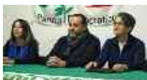
A pagina 4