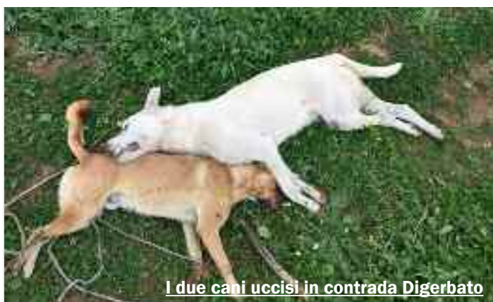
I due cani uccisi in contrada Digerbato