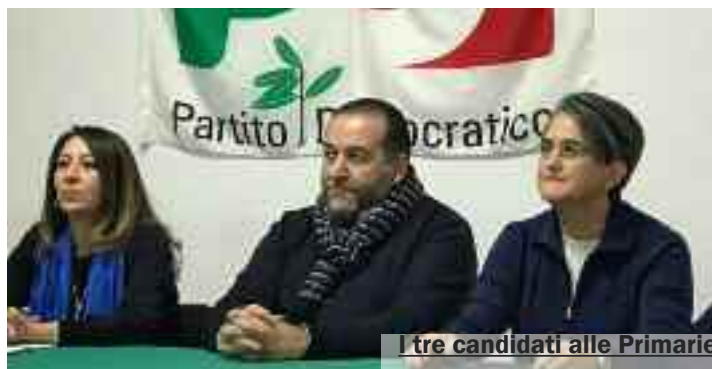
I tre candidati alle Primarie