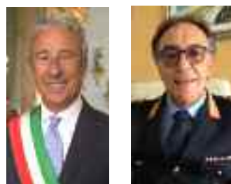
A pagina 7