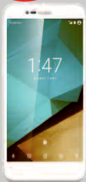
Vodafone Smart prime 2016