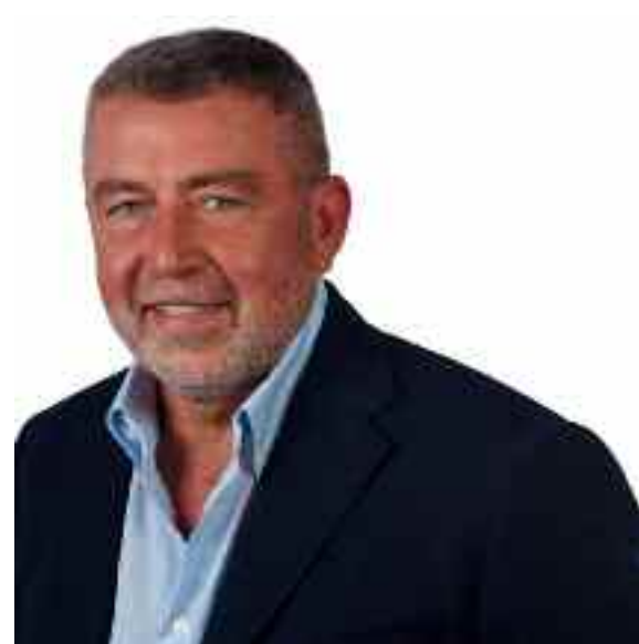
A pagina 3

Corruzione ed altro, le accuse che pendono su Fazio, su Ettore Morace e su un funzionario regionale. Sullo sfondo i finanziamenti e l'appalto per la gestione dei trasporti marittimi in Sicilia.