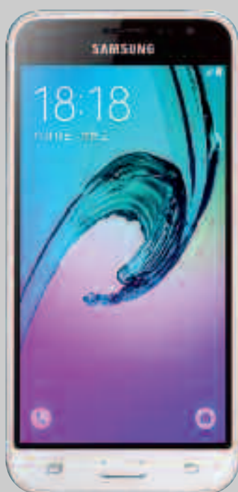
Samsung Galaxy J3 2016