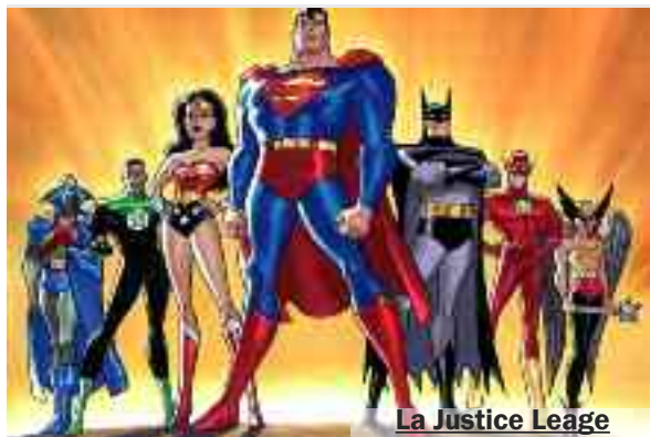
La Justice League