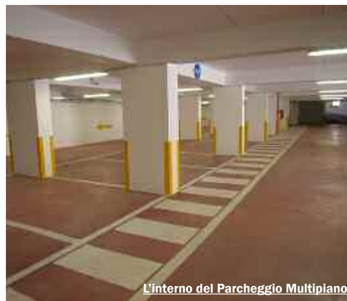
L'interno del Parcheggio Multipiano

parcheggi pagamento. Il periodo festivo purtroppo non ci ha agevolati. Archiviata la questione delle strisce blu, ci concentreremo ora sul parcheggio Multipiano. La settimana prossima procederemo al passaggio di consegne". Il parcheggio Multipiano, dopo i mesi estivi, ha registrato un sensibile calo di utenti. Come contate di rilanciare questa struttura? "Abbiamo in programma di avviare una campagna abbonamenti sia