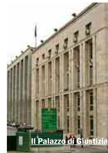
Il Palazzo di Giustizia

ora accerto se sono le misure di prevenzione o se è un accertamento che stanno facendo a Palermo". Secondo gli inquirenti, questo dialogo denota la forza e la pericolosità del sodalizio mafioso mazarese. "L'indagine - scrivono gli inquirenti - ha confermato i saldi contatti tra il clan mazarese e quello di Castelvetro e gli accordi per spartirsi gli appalti sotto le direttive del pericoloso latitante Matteo Messina Denaro".