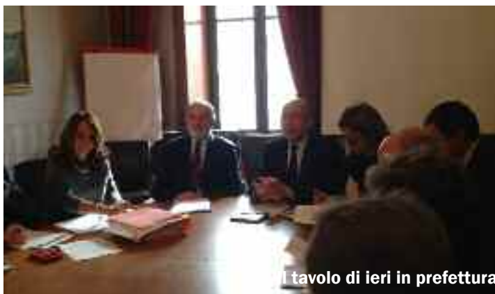
Il tavolo di ieri in prefettura

E' stato il primo esperimento in Sicilia, quello che si è svolto ieri nella sala riunioni della Prefettura di Trapani. Una conferenza di servizi telematica alla presenza del direttore dell'Agenzia nazionale per l'amministrazione e la destinazione dei beni confiscati alla mafia, prefetto Umberto Postiglione, con l'obiettivo di accelerare i tempi per l'assegnazione e la fruizione dei beni sottratti alla malavita organizzata. Attraverso il complesso sistema denominato "Open Regio" infatti, è stata creata una banca dati a cui è possibile accedere per visionare gli immobili confiscati e deciderne la nuova destinazione. Ieri al tavolo c'erano tutti i soggetti interessati: dai rappresentanti del demanio, ai sindaci, passando per gli esponenti delle forze dell'ordine e della magistratura. Ognuno, pronto ad esporre le proprie esigenze all'Agenzia sulla base dei progetti di riutilizzo dei 142 immobili confiscati e disponibili, tutti nel territorio trapanese. Il loro valore ammonta a circa 18 milioni di euro. "Il nostro è un progetto ambizioso - ha spiegato il prefetto Postiglione - ma ne-