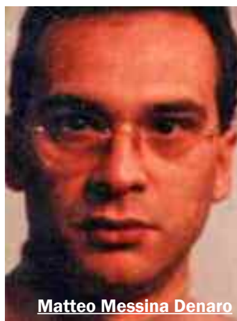
Matteo Messina Denaro