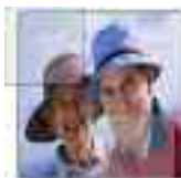
ristorazione case di riposo