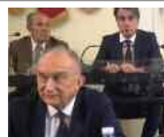
A pagina 4

Trapani Nulla di fatto per il consiglio su Birgi