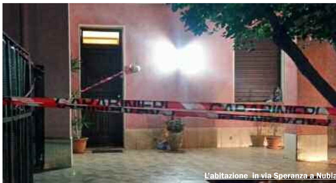
L'abitazione in via Speranza a Nubia