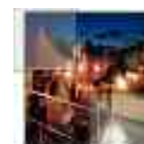
catering e banchetti