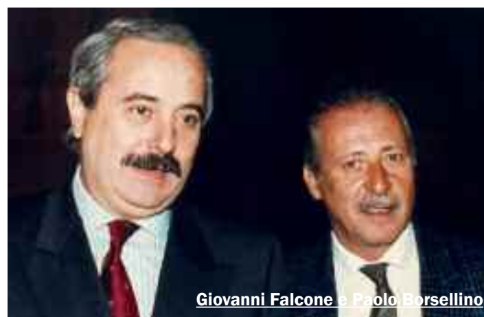
Giovanni Falcone e Paolo Borsellino

cone fu poi ucciso il 23 maggio del 1992 a Capaci. Un mese dopo fu la volta di Paolo Borsellino e della sua scorta. L'udienza preliminare è fissata per il pros-