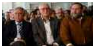
A pagina 5

Erice I socialisti sono pronti: "Nacci vincente"