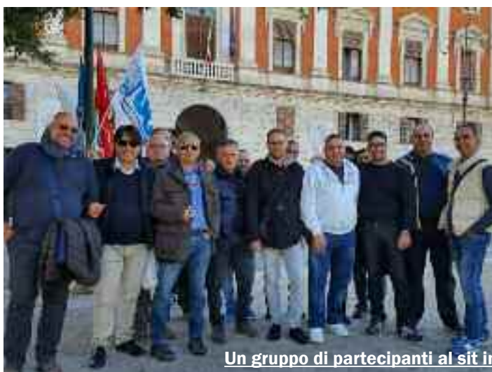
Un gruppo di partecipanti al sit in

fatti, ieri mattina ha ricevuto una delegazione di lavoratori e sindacalisti ed ha assicurato loro che entro la prossima settimana convocherà sindacati e associazioni datoriali per un confronto tra le diverse parti a proposito dei ritardi nel pagamento degli stipendi.