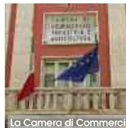
La Camera di Commercio

Camera di Commercio di Trapani e Ufficio scolastico regionale hanno organizzato l'incontro "Alternanza day", in linea con i progetti previsti dal programma Alternanza Scuola Lavoro. L'appuntamento è per lunedì 2 ottobre, presso il salone della Camera di Commercio. L'alternanza scuola - lavoro, infatti, ormai obbligatoria per tutti gli studenti dell'ultimo triennio delle scuole superiori, è un progetto formativo introdotto dalla legge 107 del 2015 - "La Buona Scuola". La norma si sforza di mettere in collegamento il mondo del lavoro con la scuola e coinvolge aziende, associazioni (sportive, culturali) e istituzioni che possono diventare figure educative per gli studenti in relazione alle loro propensioni e aspirazioni. Nell'incontro i relatori presenteranno: le nuove funzionalità del Registro Nazionale Alternanza Scuola Lavoro; i nuovi progetti delle Camere di Commercio; la promozione del premio "Storie di alternanza"; la presentazione dei bandi, in fase di pubblicazione, per contributi alle imprese. Le aziende potranno iscriversi al Registro nazionale, attraverso postazioni PC dedicate, gestite da quattro studenti dell'Industriale già attivamente impegnati in un progetto di alternanza scuola lavoro. (G.L.)