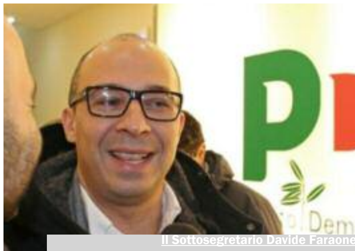
Il Sottosegretario Davide Faraone

Hanno deciso di bypassare la Regione ed andare direttamente alla fonte: al governo centrale. Per sbrogliare l'intricata matassa del futuro dell'aeroporto trapanese e cercare così risposte concrete per incrementare l'asfittica economia del territorio. Lunedì sera una delegazione di imprenditori del settore turistico trapanese si sono messi in macchina e sono partiti alla volta di Palermo dove ad aspettarli, nella sua segreteria, c'era il sottosegretario Davide Faraone. Per raccontare tutti i problemi dello scalo aeroportuale trapanese c'è voluto del tempo. Dalla necessità di rinnovare prima possibile il contratto di co marketing con gli irlandesi pena la fuga di Ryanair da Trapani alla ricapitalizzazione dell'Airgest, passando dalla necessità di aumentare i servizi su Birgi così da ripianare le perdite. Ma soprattutto gli operatori economici hanno chiesto che Birgi venga considerato un'aeroporto strategico e non più secondario nel piano degli scali aeroportuali italiani. Un modo, ancora una volta per bypassare la Regione e far sì che