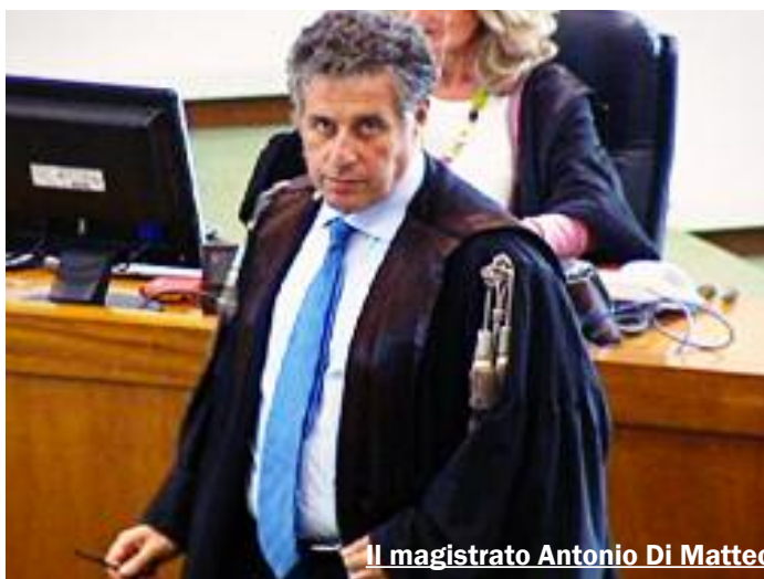
Il magistrato Antonio Di Matteo

Titolare di un'inchiesta che fa paura a tanti, quella sulla trattativa Stato-mafia, che si sviluppa nel solco del Lavoro di Chinnici, Falcone e Borsellino, Di Matteo è il magistrato più a rischio del nostro Paese. Da oltre vent'anni è in prima linea nella lotta a cosa nostra. Le indagini che Di Matteo ha diretto e continua a dirigere, ritenute scomode persino da alcuni uomini delle istituzioni, lo hanno reso il bersaglio numero uno dei boss più influenti: Totò Riina e Matteo Messina Denaro. E' del 2013 l'intercettazione del boss di Corleone che durante un colloquio privato nel carcere dell'Opera di Milano con un