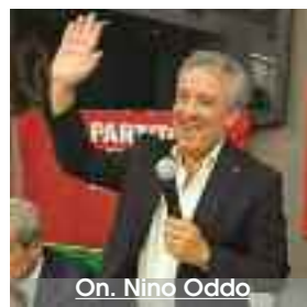
On. Nino Oddo

Si candida nuovamente (è, complessivamente, la sua decima candidatura a qualcosa) e parte da ciò che ha fatto all'Ars nel ruolo di Deputato Questore: "Ho ridotto, insieme ai miei colleghi parlamentari, i costi degli apparati regionali e soprattutto ho reso pubblici i dati, regolamentando l'utilizzo delle auto blu che sono state ridotte di due terzi. Ma non solo, ho avuto l'onore di dare il mio nome a un DDL sulle Biobanche e ho lavorato per Birgi assicurando