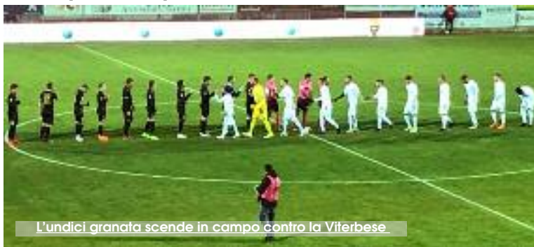
L'undici granata scende in campo contro la Viterbese