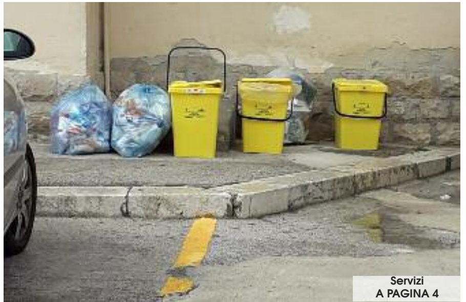
Servizi A PAGINA 4