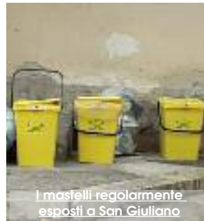
I mastelli regolarmente esposti a San Giuliano

comunale che sono fiducioso possa condividere la nostra proposta per evitare ulteriori aggravii alle tasche dei nostri concittadini. Sugli avvisi che gli utenti stanno ricevendo in queste ore sull'acconto TARI per l'anno in corso, infine, è opportuno precisare come le stesse siano riferite al conguaglio dell'anno 2018 e che, dunque, non riguardano la manovra che stiamo proponendo in queste ore."