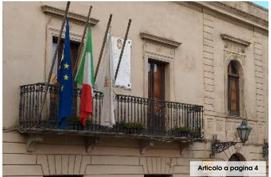
Articolo a pagina 4