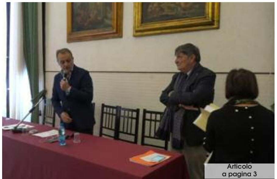
Articolo a pagina 3