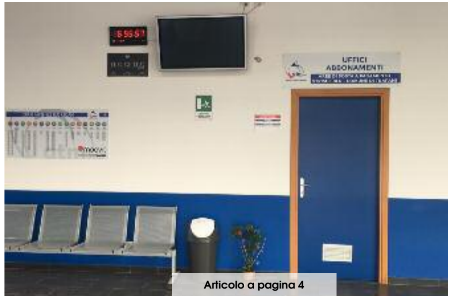
Articolo a pagina 4