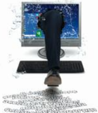
La copertina del libro di Margana Edizioni

storie di ministri, scrittori, manager e blogger sgrammaticati