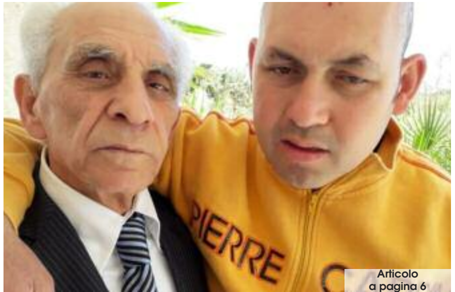
Articolo a pagina 6