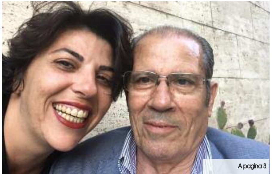
A pagina 3