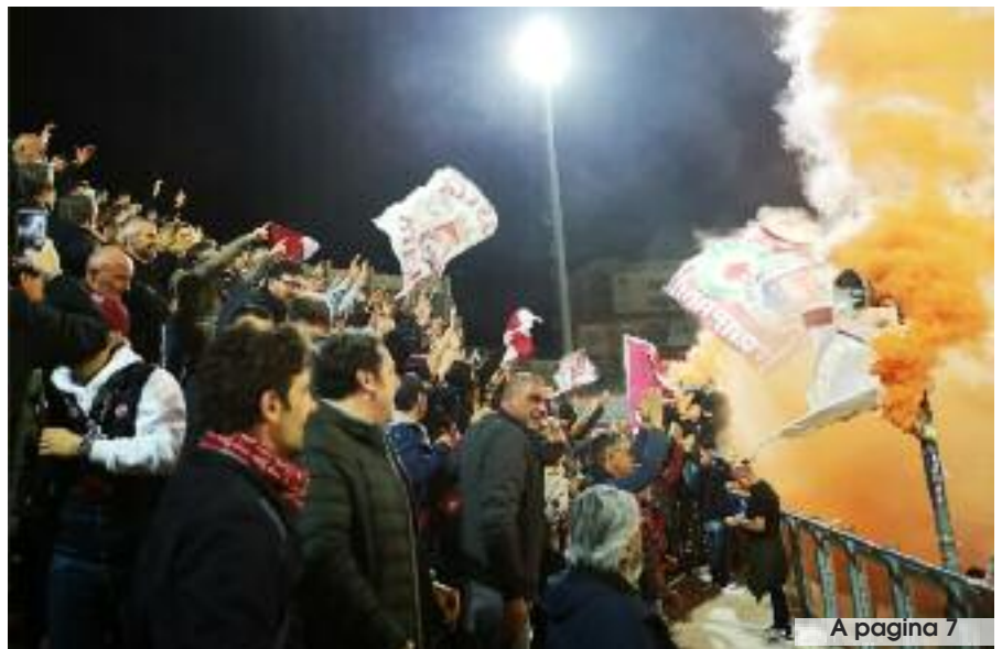
A pagina 7