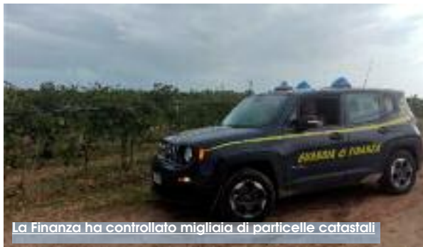
La Finanza ha controllato migliaia di particelle catastali

stupore che alcuni suoi terreni erano già condotti da altra ditta, a lui del tutto sconosciuta. Una sorta di furto di identità del terreno i cui dati catastali comparivano già in altra pratica di sostegno a valore sui fondi PAC. A partire da questo primo caso di frode i finanzieri di Castelvetrano hanno sviluppato un'analisi a più ampio raggio. È emerso che il caso non era isolato e che altri soggetti per ottenere indebitamente le contribuzioni, hanno trasmesso all'Agenzia per le Erogazioni in Agricoltura atti falsi e attestazioni mendaci circa la titolarità del diritto di proprietà o altri diritti reali su terreni agricoli. I finanzieri hanno individuato migliaia di particelle catastali, alcune corri-