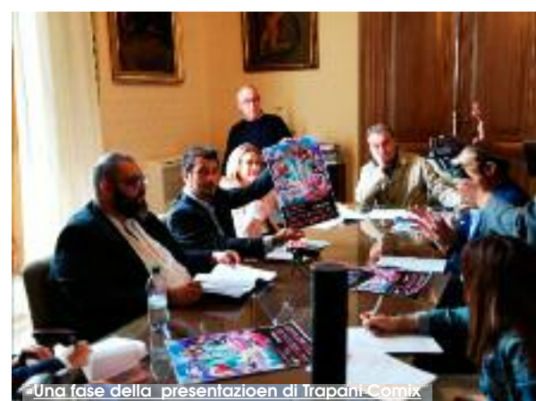
Una fase della presentazione di Trapani Comix