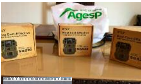
Le fototrappole consegnate ieri