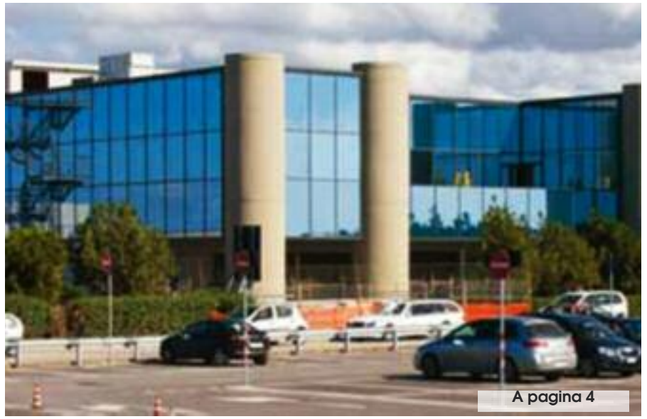
A pagina 4