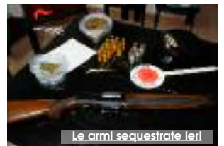
Le armi sequestrate ieri

controllata costantemente da un sistema di video sorveglianza, che permetteva di controllare gli eventuali movimenti di polizia, carabinieri e guardia di Finanza. All'interno della villetta di Valenza i carabinieri rinvennero anche un fucile automatico calibro 12 a canne