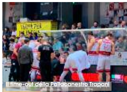
Il time-out della Pallacanestro Trapani