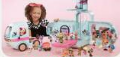
LOL GLAMPER + PLAID LOL OMAGGIO