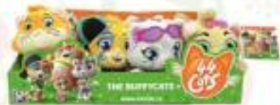
44 GATTI PELUCHE ASSORTIVI

Guarda il volantino completo sulla nostra pagina Facebook Brillante Giochi .