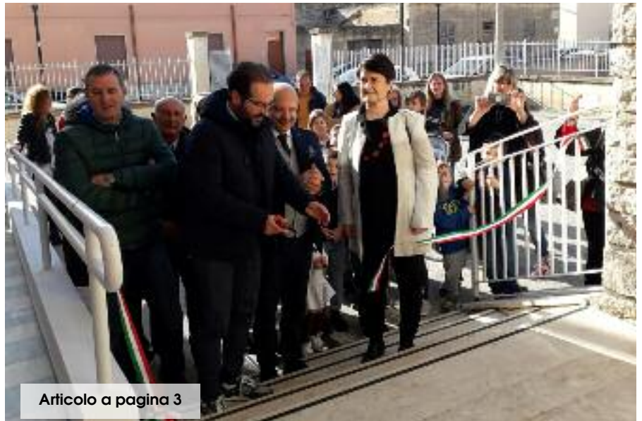
Articolo a pagina 3