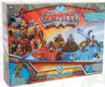
ISOLA DI GORM