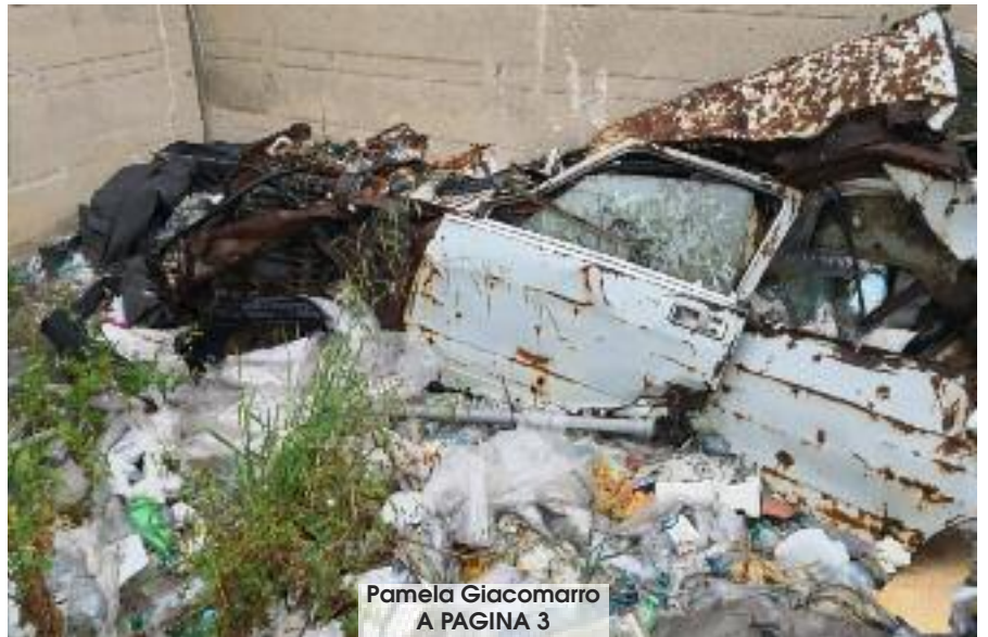
Pamela Giacomarro A PAGINA 3