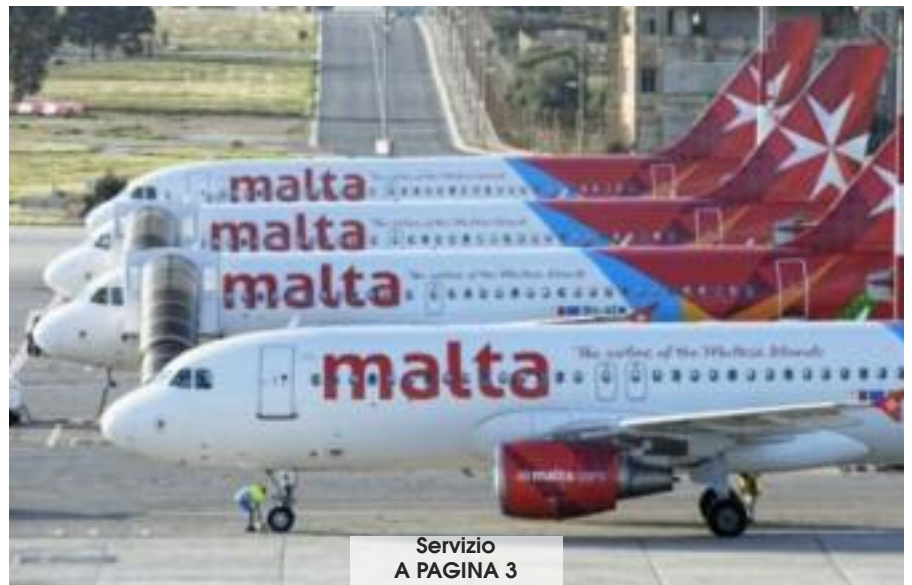
Servizio A PAGINA 3