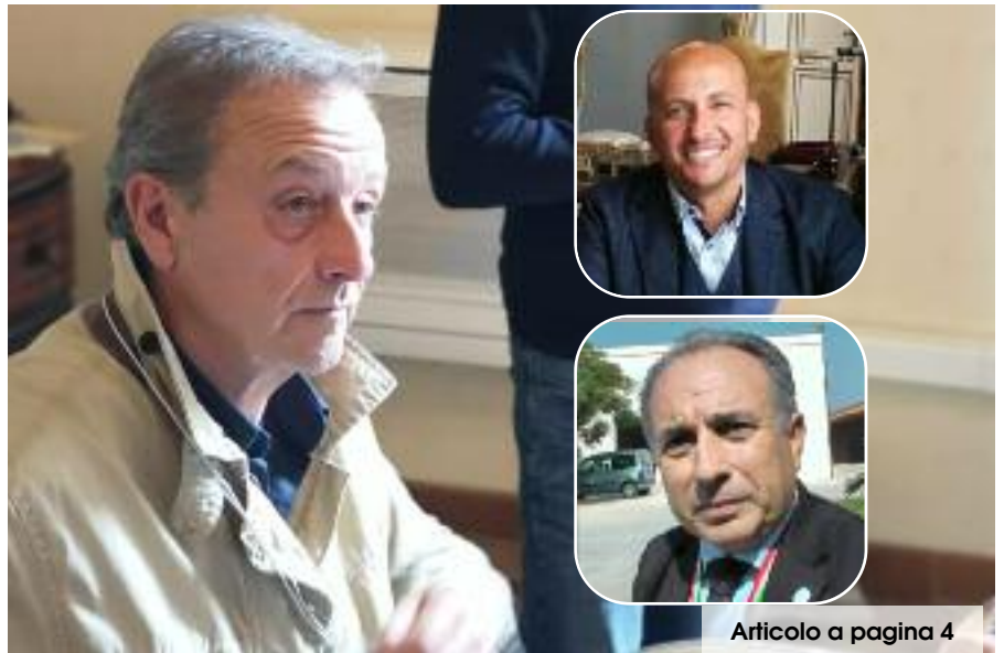
Articolo a pagina 4