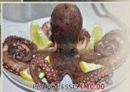
POLPO LESSO € 10,00