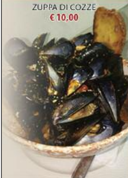
ZUPPA DI COZZE € 10,00