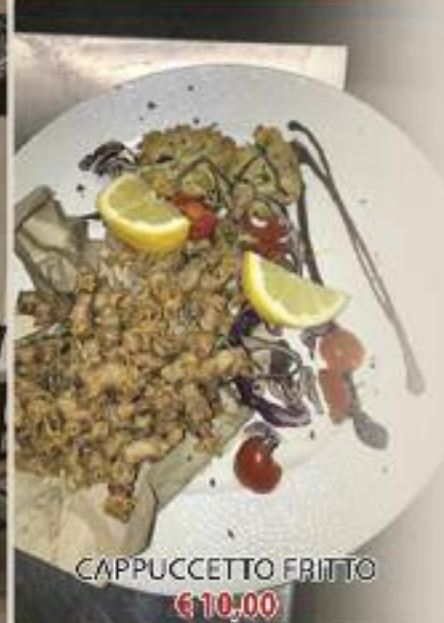
CAPPUCCETTO FRITTO € 10,00