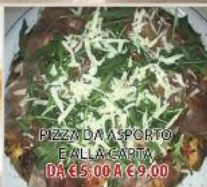
PIZZA DA ASPORTO E ALLA CARTA DA € 5,00 A € 9,00