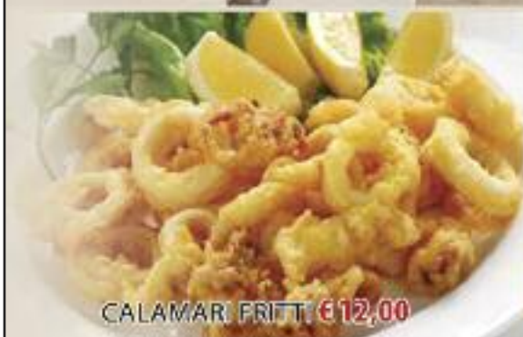
CALAMARI FRITTI € 12,00