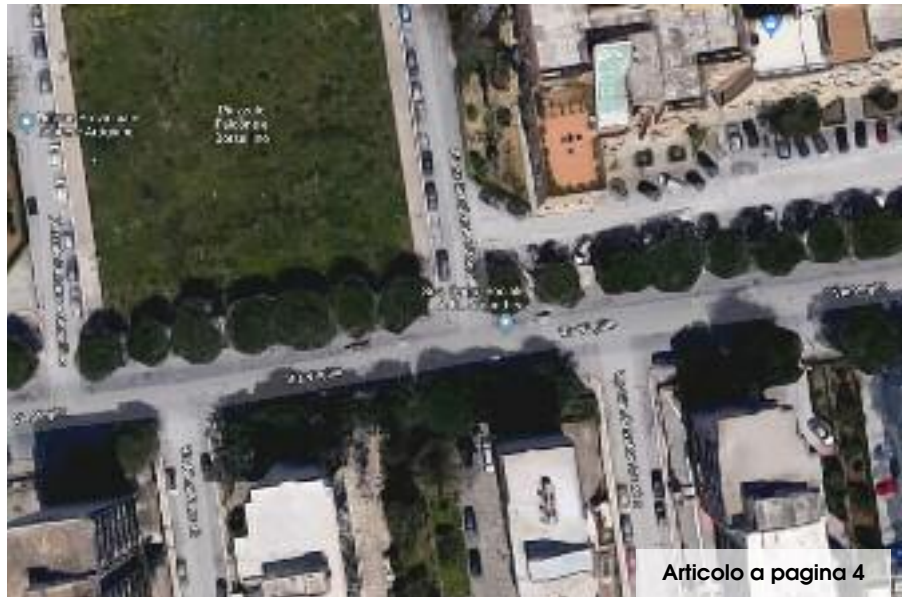
Articolo a pagina 4