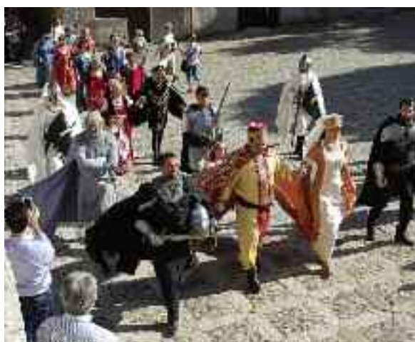
Un momento della manifestazione ericina

La Quarta Edizione della FedEricina ha riscontrato un grande successo e registrato un elevato numero di turisti, che soprattutto nelle prime due giornate hanno affollato il Borgo, incuriositi dalla particolarità dell'evento, dalle pietanze preparate e affascinati dagli spettacoli equestri e duelli avvenuti nel bel