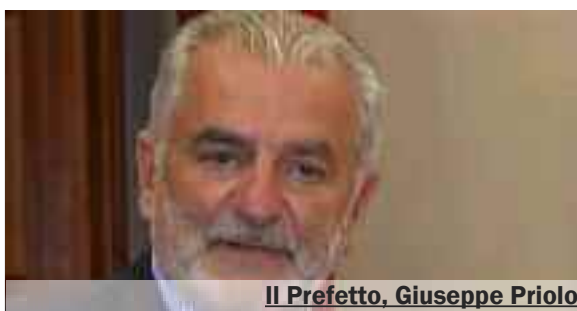
Il Prefetto, Giuseppe Priolo

sette Comuni e sono stati effettuati accessi, alcuni con esito negativo, uno è in corso nel Comune di Castelvetrano. E proprio su quest'ultimo, dove si dovrebbe andare al voto il prossimo 11 giugno, salvo provvedimenti, si è concentrata la parte più importante dell'audizione del prefetto. Priolo ha fatto riferimento a possibili intrecci tra mafia e massoneria. “Non ho elementi nuovi o diversi rispetto a quelli che questa Commissione ha già acquisito nelle audizioni del luglio scorso. In questa sede non posso valutare, se non in termini di supposizioni, ovvero di ragionevoli presunzioni, la possibile comunanza di interessi tra le organizzazioni, quella massonica e quella mafiosa, che fanno della segretezza una regola rigida e inderogabile. “Abbiamo riscontrato – ha aggiunto il prefetto – una presenza della massoneria in moltissime realtà della provincia di Trapani e, in particolare, ancora più massiccia proprio nel Comune di Castelvetrano. Presenza massiccia di iscritti alla massoneria è emersa nell'ambito della compagine governativa, assessori, consiglieri comunali oltre che