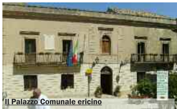
Il Palazzo Comunale ericino