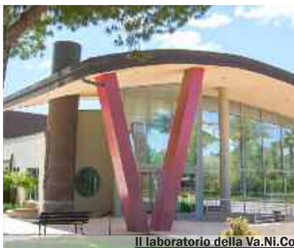
Il laboratorio della Va.Ni.Co.