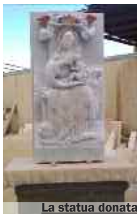
La statua donata