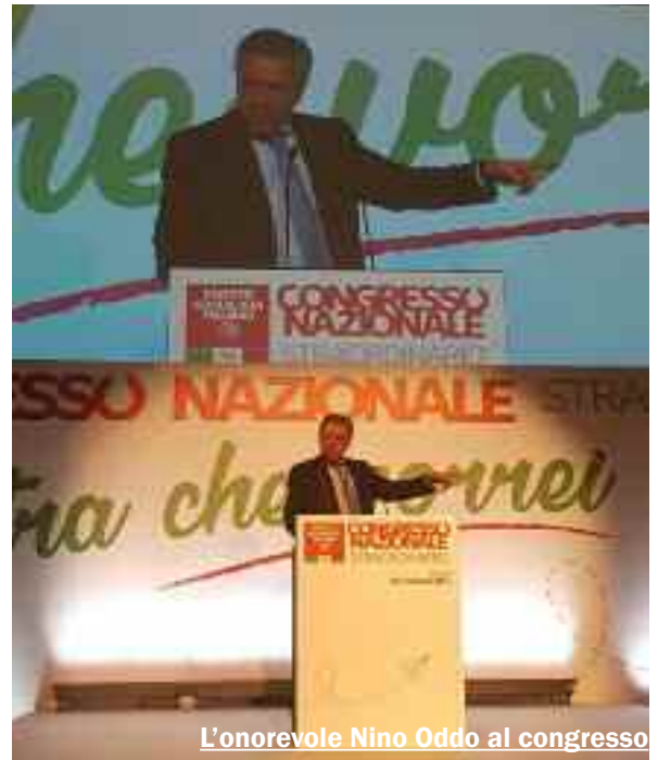
L'onorevole Nino Oddo al congresso

rivato il momento per una grande azione politico-amministrativa per il territorio. Si attende solo l'ufficializzazione del senatore d'Ali e, probabilmente, questa arriverà fra qualche settimana. In attesa che il parlamentare nazionale scioglia del tutto le sue riserve (pare che sia molto più certo di scendere in campo in prima persona) i socialisti lavorano e sabato, dal Baia dei Mulini, avvieranno la macchina elettorale. Sia su Trapani che su Erice. La provincia di Trapani, intanto, annovera otto rappresentanti nel nuovo Consiglio nazionale PSI. Si tratta di Anna Barbiera (Trapani), Franco Spedale (Mazara del Vallo), Cathy