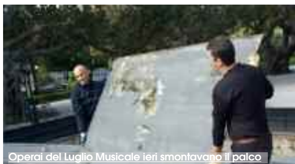
Operai del Luglio Musicale ieri smontavano il palco

L'Ente Luglio Musicale Trapanese è stato invitato a smontare, dai giardini di Villa Margherita, quanto è rimasto della struttura del teatro all'aperto. Una sollecitazione non ufficiale giunta dalle pagine di Facebook. La richiesta di rimozione delle strutture mobili del teatro è stata avanzata, ciclicamente, dal gruppo di cittadini iscritti alla pagina "Cosa ne facciamo a Trapani del..." (creata per segnalare disservizi e animare riflessioni e discussioni su Trapani), affinché la Villa Margherita, ed in particolare l'edera, venisse restituita alla fruizione pubblica. Segnalazioni reiterate già a partire dalla stagione lirica 2016 e rinnovate con vigore al termine della stagione lirica 2017. In verità il Luglio, dopo un primo