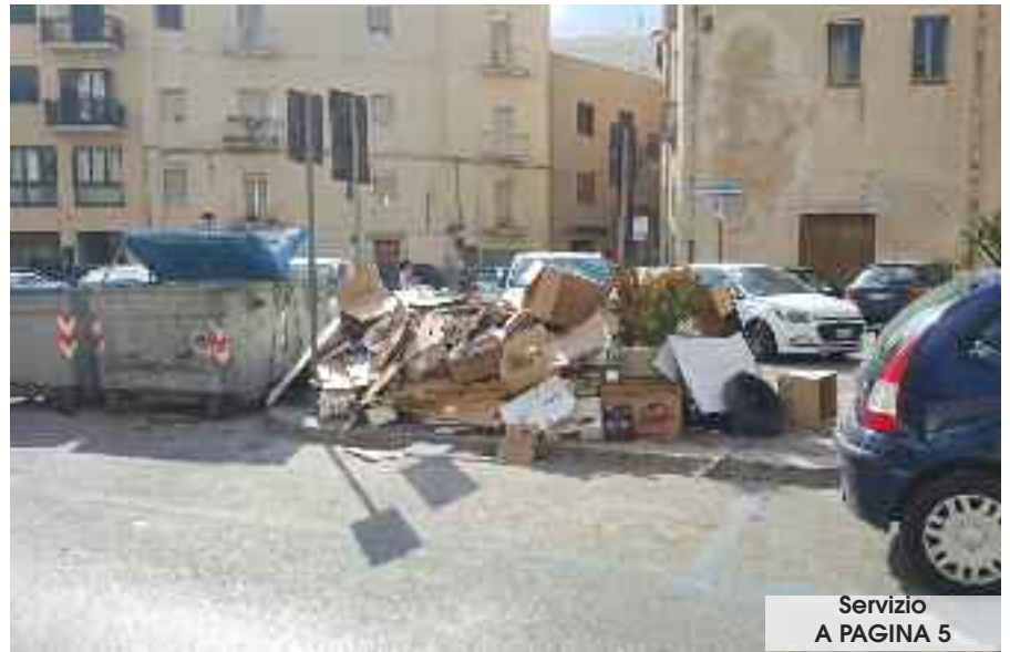
Servizio A PAGINA 5