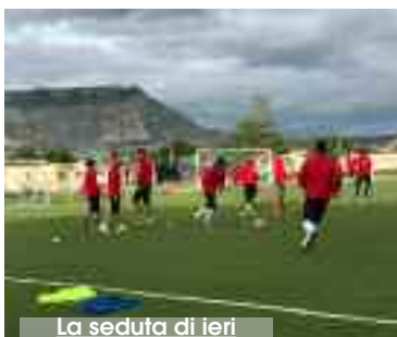
La seduta di ieri