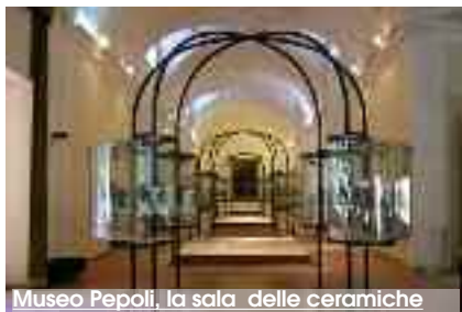
Museo Pepoli, la sala delle ceramiche

L'associazione Amici del Museo Pepoli ha celebrato il decennale della sua fondazione. L'associazione è stata fondata per iniziativa di cittadini e associazioni culturali trapanesi, con lo scopo prioritario di promuovere la conoscenza e valorizzare il patrimonio storico e artistico del museo che nasce dal mecenatismo del Conte Agostino Pepoli, insigne trapanese vissuto anche a Bologna, che ai primi del '900 donò il primo nucleo di reperti archeologici e gran parte dei quadri della attuale pinacoteca. Nel corso degli anni l'associazione ha svolto parecchi incontri con personalità della cultura e dell'arte, visite guidate, conferenze, mostre e laboratori didattici, oltre che finanziato restauri di opere. In dieci anni il numero dei soci è aumentato arrivando ad oggi a centocinquanta iscrizioni. Fiore all'occhiello del museo sono le attività rivolte agli studenti di ogni ordine e grado ai quali sono destinati dei percorsi tematici e attività laboratoriali all'in-