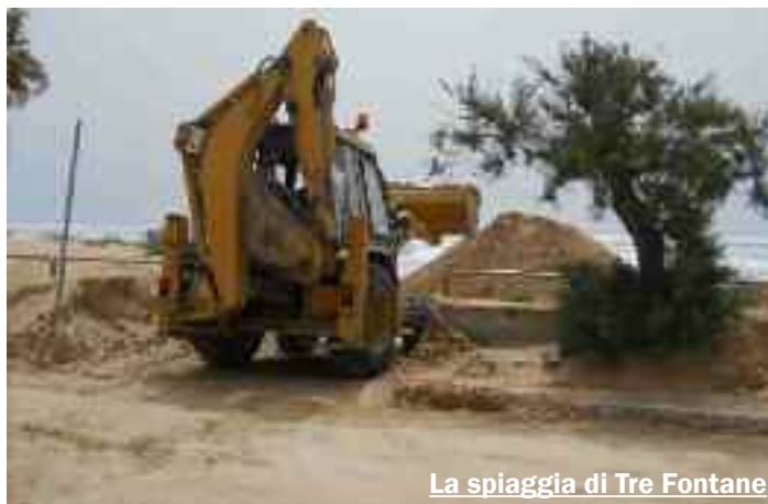
La spiaggia di Tre Fontane