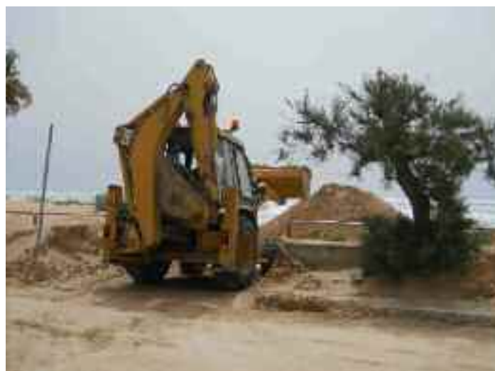
Alle pagine 3 e 7