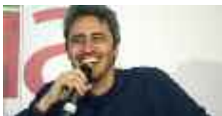
A pagina 5

Erice Cittadinanza all'attore Pif tra le polemiche