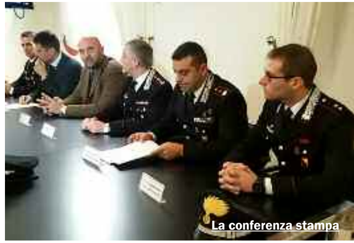
La conferenza stampa

meo, sono stati invece sottoposti alla misura cautelare del divieto di esercizio d'impresa. I reati ipotizzati vanno dall'associazione a delinquere di stampo mafioso alla fittizia intestazione di beni e turbata libertà degli incanti. Le indagini hanno preso il via lo scorso anno. Il nome di Rosario Firenze è saltato fuori nel corso di alcune intercettazioni svolte nell'ambito di un'indagine di mafia. Secondo gli investigatori, l'imprenditore castelvetranese è uno dei più fidati fiancheggiatori del boss Matteo Messina Denaro. Frequentazioni e rapporti sospetti che non sono