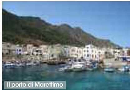
Il porto di Marettimo

Il Sindaco delle Egadi, Giuseppe Pagoto, ha inviato una nota al Ministro dell'Ambiente, Gian Luca Galletti, chiedendo un intervento straordinario che consenta di attivare misure di sostegno da destinare alla marineria di Marettimo. «L'isola - spiega Pagoto - più delle altre, versa in condizioni di disagio, a causa della distanza dalla terraferma che la rende meno accessibile e spesso isolata. A soffrire è anche la pesca professionale di Marettimo, che rappresenta una delle fonti di reddito principali degli abitanti, ormai rappresentata da poche barche che operano per pochi mesi all'anno. L'abbandono di tali mestieri sarebbe una gravissima perdita di identità dell'isola, che come Comune e Area Marina Protetta dobbiamo assolutamente evitare». «La richiesta formulata al Ministro - prosegue Pagoto - punta a ottenere un finanziamento straordinario per il monitoraggio delle specie protette, e per indennizzare i pescatori a cui vengono distrutte le reti dai delfini». (R.T.)