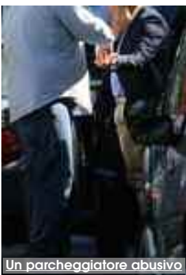
Un parcheggiatore abusivo