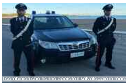
I carabinieri che hanno operato il salvataggio in mare

cino privato e insieme ai due proprietari del natante, ha raggiunto la zona di mare dove aspettavano ancora gli altri due turisti. La presenza del gommoncino ha consentito di impedire che il moto ondoso li travolgesse e li allontanasse dalla riva. Le condizioni del mare erano talmente avverse che il gommoncino utilizzato per il soccorso ha rischiato di ribaltarsi. I cinque turisti, tratti in