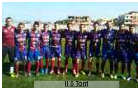
Il 5 Torri

Nel campionato di Promozione è da definire netta la sconfitta subita dal Cinque Torri Trapani sul terreno del Città di Castellammare per 3-1. Un insuccesso che allontana i trapanesi dalla zona play off. In ogni caso il sesto posto in condominio col Vallelunga non è da buttar via. Da registrare l'affermazione del Castellammare 94 sul campo della Libertas 2010 (0-1) e la battuta d'arresto interna del Campobello ad opera del Partinicaudace. Nel campionato di I Categoria tutti successi per le trapanesi ad eccezione dello Strasatti caduto a Palermo (2-1) sul rettangolo di gioco dello Sparta. Hanno vinto il Valderice (0-2) sul terreno palermitano del Rangers 1986, il Città di San Vito Lo Capo in casa col Città di Carini (3-0) e il Fulgatore in campo esterno per 2-0 in casa del Città di Cinisi. In classifica è primo il Fulgatore assieme al Borgo nuovo a punteggio pieno.