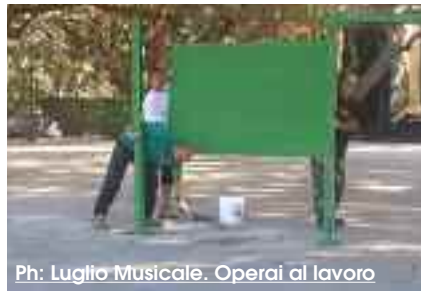
Operai al lavoro

L'Ente Luglio Musicale ha avviato le operazioni di smontaggio del teatro "Giuseppe Di Stefano". Presto l'edera della villa comunale Margherita tornerà fruibile. L'impianto perimetrale all'aperto da due anni non veniva smontato e la circostanza aveva creato alcune polemiche, per lo più manifestate attraverso i social. Più volte è stato contestato al Luglio musicale di non aver proceduto a fine stagione a smantellare gli impianti. Dal canto suo l'Ad, Giovanni De Santis, ha spiegato che l'ente ha subito la costante riduzione delle risorse finanziarie e l'operazione di smontaggio è stata rinviata per mancanza di fondi: «Nonostante le scelte scellerate di una parte del precedente consiglio comunale, che ha ridotto la dotazione, mettendo l'ente in difficoltà e in crisi di liquidità - ricorda De Santis - abbiamo comunque allestito una stagione dignitosa. Ricordo ai detrattori che i lavoratori del Luglio, compresi gli addetti allo smontaggio, stanno operando da tre mesi senza stipendio». (F.P.)