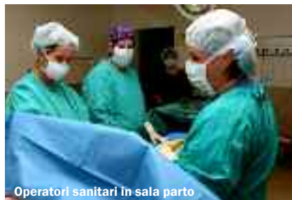
Operatori sanitari in sala parto

Tra le patologie oncologiche dell'apparato genitale femminile il 40% dei casi che riguarda il tumore al collo dell'utero viene diagnosticato in donne sotto i 40 anni. È uno dei dati indicativi emersi, nei giorni scorsi, al congresso provinciale dell'associazione dei ginecologi italiani. Si tratta spesso di tumori al primo stadio che possono essere curati con una terapia che non danneggi la fertilità. Il tumore alle ovaie, invece, colpisce le donne al di sotto dei 40 anni nel 14% dei casi. Poiché negli ultimi anni l'età in cui si ricerca la prima gravidanza è vicina ai 40 anni, conoscere questi dati epidemiologici è fondamentale per salvaguardare la fertilità delle donne. Seconda tematica affrontata durante i lavori è stata la sicurezza in sala parto. In Sicilia, dal 2015 ad oggi è stato ridotto il tasso di primi tagli cesarei, senza che sia stata modificata la percentuale di bimbi nati in buona salute. Il risultato, secondo i convegnisti, è frutto delle maggiori competenze acquisite, attra-