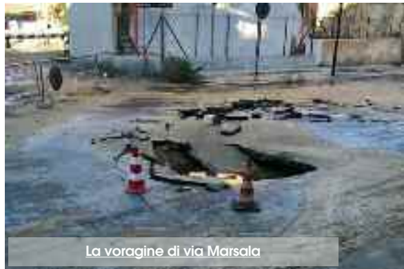
La voragine di via Marsala

La circolazione nella zona ha subito pesanti rallentamenti per cui è sconsigliato transitare sulla via Marsala se non strettamente ne-