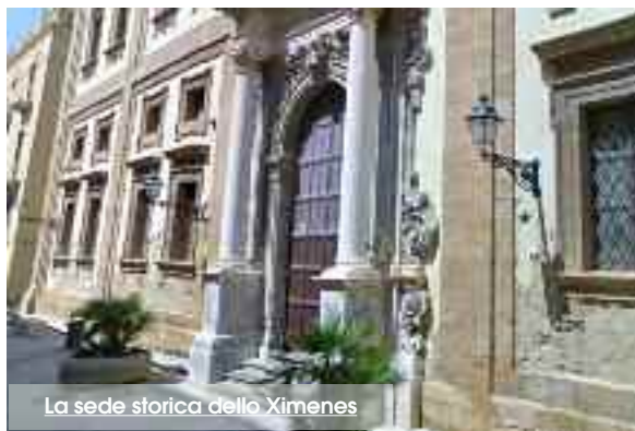
La sede storica dello Ximenes

dell'ex tribunale di Trapani e da questo, poi, sulla via Roma. Una via di fuga indispensabile senza la quale il piano di sicurezza non può essere validato per l'intera popolazione scolastica. L'immobile dell'ex Tribunale appartiene al Comune di Trapani che con ordinanza del commissario straordinario, Francesco Messineo, ha interdetto non solo l'intero immobile, per pericoli di crolli, ma anche il cortile che ha in comune con il Collegio dei Gesuiti. In attesa di una soluzione tecnica, intanto, ieri ha suonato la prima campanella del nuovo corso dello Ximenes. Una giornata particolare, anche per gli ex alunni del classico, alcuni riuniti in associazione che hanno tenuto accesi i riflettori sulla loro ex scuola, e che insieme ai giovanissimi stu-