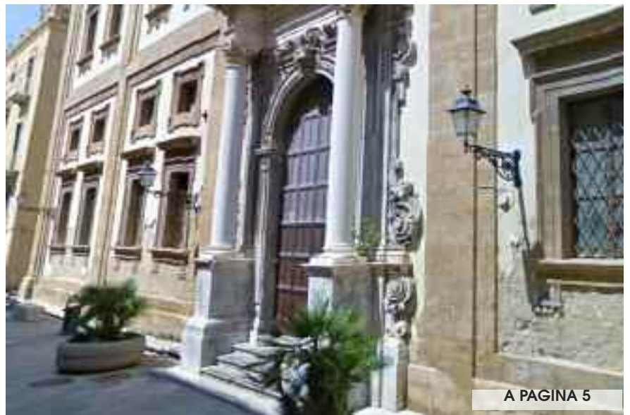
A PAGINA 5