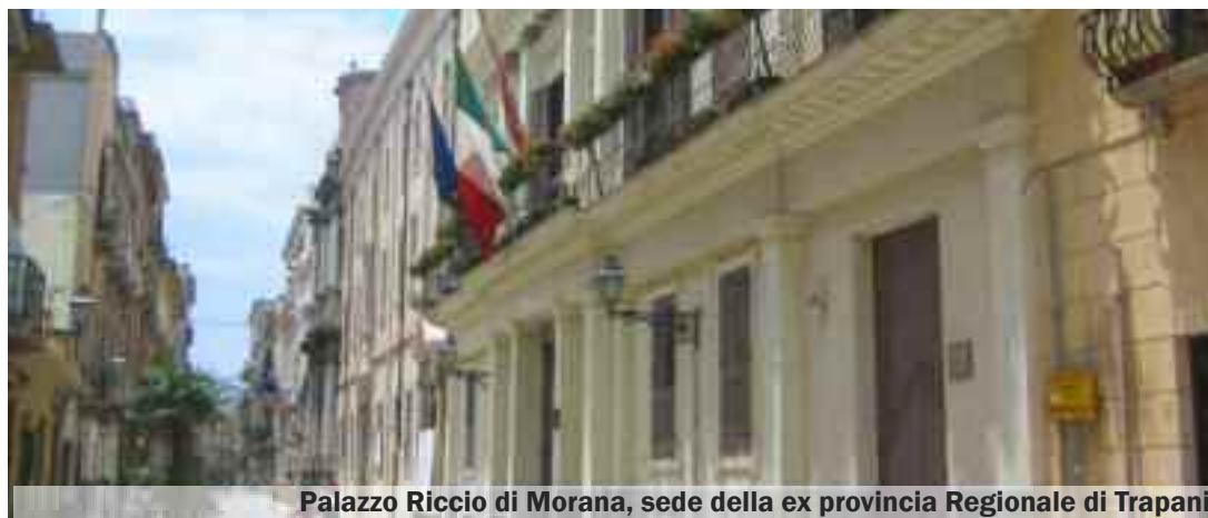
Palazzo Riccio di Morana, sede della ex provincia Regionale di Trapani

Lo stop alle assunzioni da parte del commissario era arrivato il 30 maggio del 2013 sulla base anche di alcune osservazioni della Corte dei conti sull'opportunità di nuove stabilizzazioni in enti già in difficoltà economiche. Con quell'atto, il Commissario aveva sostanzialmente annullato in autotutela la lunga e com-