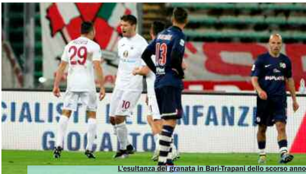
L'esultanza dei granata in Bari-Trapani dello scorso anno

Al momento in cui dissi sì alla società granata ero consapevole che avrei avuto questi tipi di problemi. Se avessi la possibilità di tornare indietro nel tempo non avrei alcuna esitazione a fare la scelta che ho fatto. Sono pronto per la terza impresa a Trapani con l'augurio che tutto l'ambiente ci creda