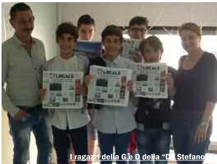
I ragazzi della G e D della "De Stefano"