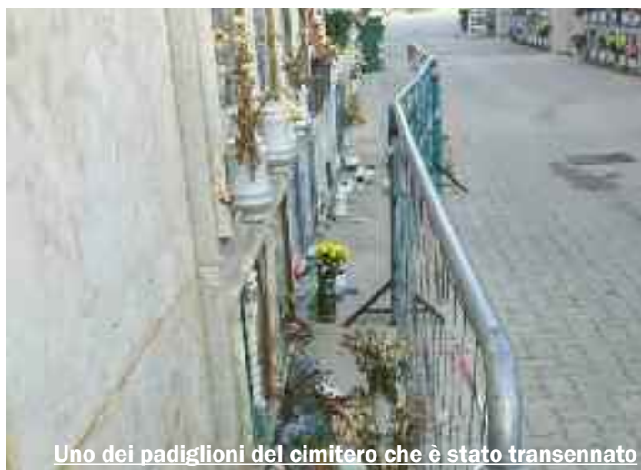
Uno dei padiglioni del cimitero che è stato transennato

Il provvedimento s'è reso necessario dopo che uno degli autoveicoli privati, che da sempre si occupano di trasportare dentro il cimitero le persone con difficoltà motorie (la gran parte ci risulta senza la necessaria autorizzazione), per il troppo traffico veicolare ha urtato una fila di loculi danneggiandone gli arredi accessori. Negli ultimi mesi la circola-