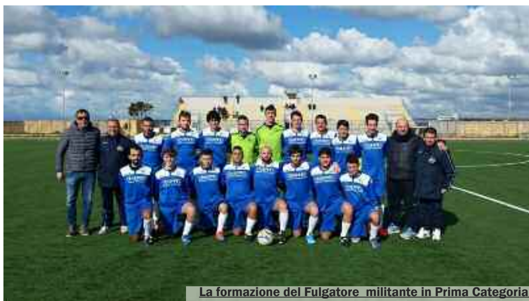
La formazione del Fulgatore militante in Prima Categoria I

Per i padroni di casa sarà un incontro da vincere per risalire la china anche se l'avversario è da prendere con le molle. L'incontro sicuramente da vedere, sul quale sono puntati i fari della giornata, è quello fra Riviera-Marmi e Folgore Selinunte, entrambe appaiate in seconda posizione a dodici lunghezze, in attesa del passo falso del Paceco per agguantare la vetta. La formazione pacecota, capolista del torneo, se la vedrà a Licata, quantomeno per non perdere, su un terreno dalle grandi tradizioni