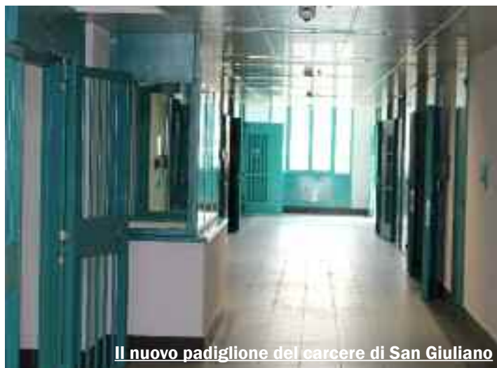
Il nuovo padiglione del carcere di San Giuliano

Il nuovo padiglione si compone di un corpo unico su quattro piani escluso il piano terra. Su ogni piano vi sono 17 camere di pernottamento, per una capienza di 51 posti detentivi. In tutto i posti letto sono 204. Il piano terra sarà adibito alle attività tratta mentali, rieducative e risocializzanti. Inoltre, sempre al piano terra è stata realizzata una cucina che sarà autonoma dal resto del carcere. Infine, nei pressi della nuova struttura è stato anche realizzato un campo di calcetto in erba sintetica. Il padiglione ha una sala regia centrale che avrà il controllo completo di tutto il reparto, sia interno che esterno, e le aperture delle celle avverrà