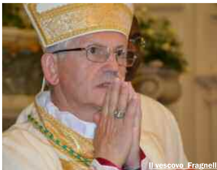
Il vescovo Fragnelli

tutti: la Diocesi e tutte le persone coinvolte in un percorso di rinnovato dialogo e di riabilitazione della dignità di tutte le vittime, nell'ottica della riconciliazione. Non aveva certo una vista corta san Paolo quando invitava le comunità cristiane a "bandire la menzogna e a dire la verità, perché siamo membra gli uni degli altri". È con questo spirito che auspichiamo che il Signore porti a compimento ogni desiderio di bene avviato in noi e tramite noi, nonostante e in forza delle nostre fragilità".