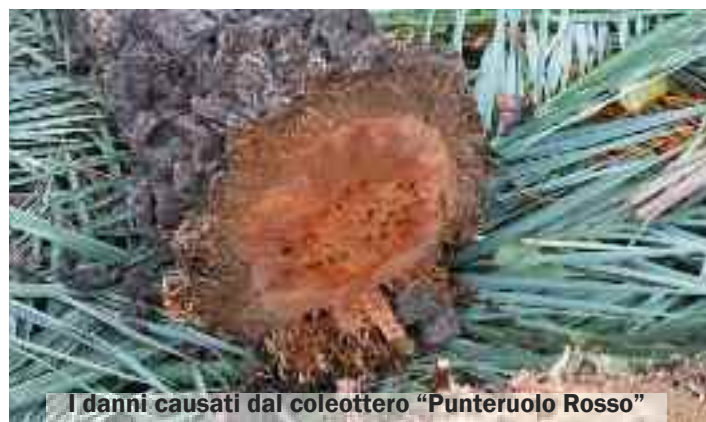
I danni causati dal coleottero "Punteruolo Rosso"

infatti, aveva l'urgenza di verificare quale fosse lo stato complessivo delle piante situate lungo quella transitatissima via che, tra l'altro, costituisce uno degli snodi principali del capoluogo, in entrata ed in uscita. Le analisi hanno dimostrato che molte piante erano appunto già state infette dal punteruolo rosso e ieri mattina ne è stato disposto il taglio e l'abbattimento.