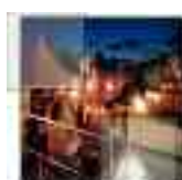
catering e banchetti