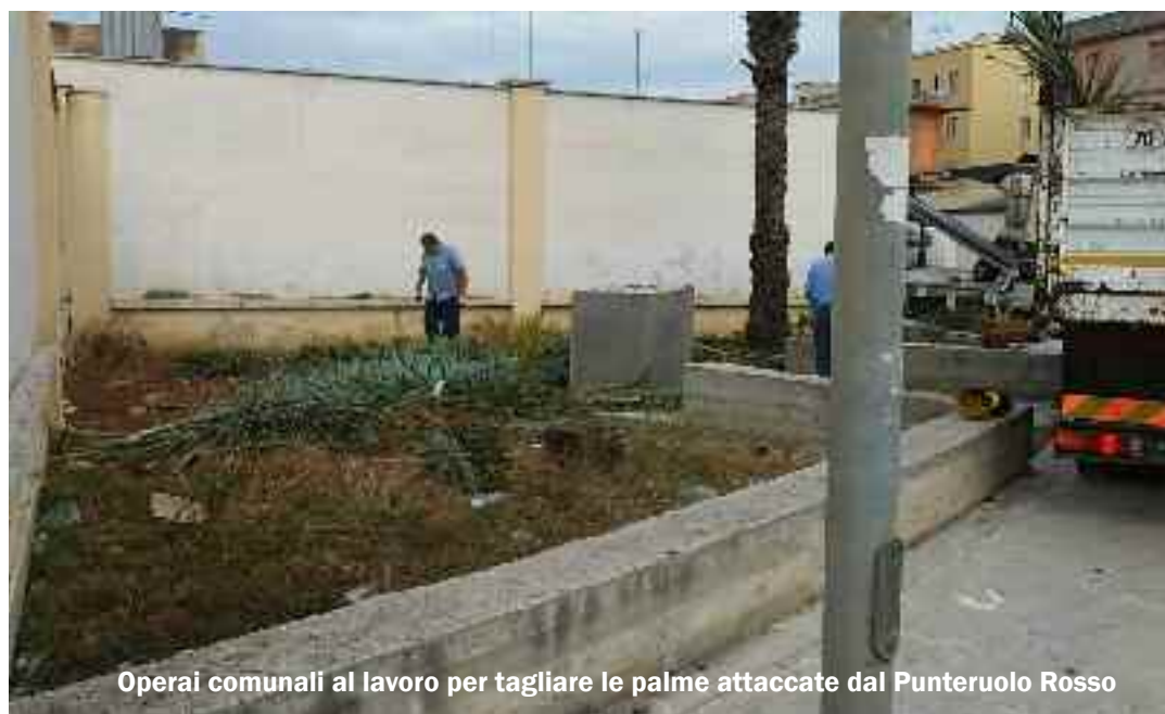
Operai comunali al lavoro per tagliare le palme attaccate dal Punteruolo Rosso

Le palme, infatti, presentavano per la grande maggioranza numerosi fori di ingresso del coleottero, conosciuto come punteruolo rosso. L'Amministrazione Comunale di Trapani,