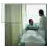
ristorazione diniche ed ospedali