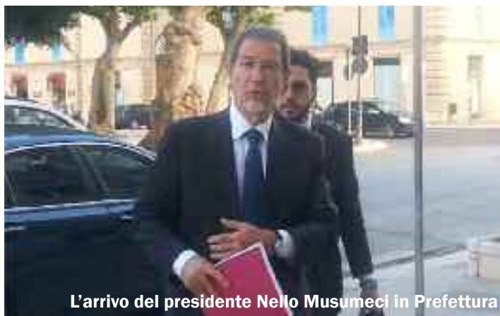
L'arrivo del presidente Nello Musumeci in Prefettura

"Abbiamo lavorato per quasi due anni. È stato un lavoro lungo e complesso. A breve sarà pronta la relazione conclusiva. Posso però anticipare sin da