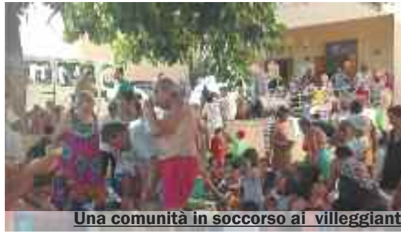
Una comunità in soccorso ai villeggianti

Hanno trascorso la notte in strutture ricettive (b&b o alberghi) messe a disposizione gratuitamente dai proprietari circa 250 ospiti del Villaggio Calampiso che mercoledì sera non hanno potuto fare ritorno nelle proprie abitazioni; altre 500 persone sono tornate a casa dopo aver potuto riprendere le proprie autovetture grazie all'AST e ai privati che hanno messo a disposizione bus e pulman per raggiungere il Villaggio chiuso dopo l'incendio.