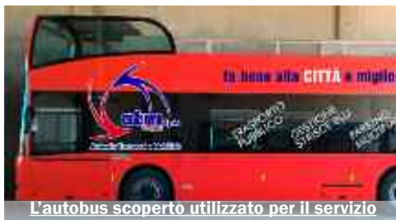
L'autobus scoperto utilizzato per il servizio

Il servizio è stato implementato esclusivamente da ATM TRAPANI s.p.a. senza il contributo economico del Comune di Erice e della Funierice, con i quali comun-