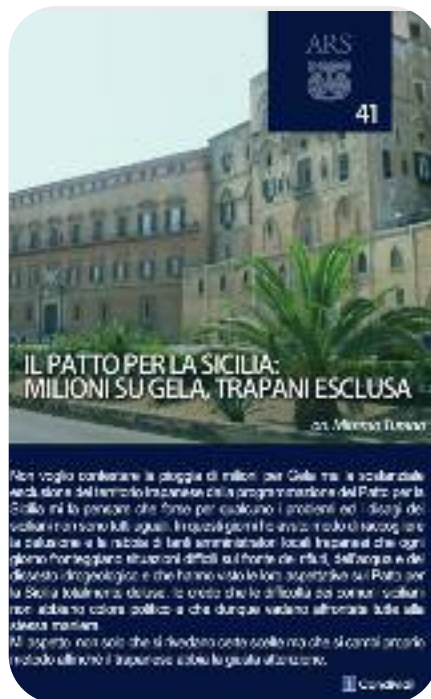
Non voglio confermare la pioggia di milioni su Gela ma le scolarie della sede della Regione trapanese dalla programmazione del Patto per la Sicilia mi fa pensare che forse per ciascuno i problemi ed i disagi dei comuni non sono tutti uguali. In questi giorni ho avuto modo di leggere la relazione e la nota di tanti amministratori locali trapanesi che ogni giorno fronteggiano situazioni difficili al fronte dei rifugi, dell'acqua e del dissesto idrogeologico e che hanno visto le loro interpellanze al Patto per la Sicilia Malintesa decise. Il resto della difficoltà dei comuni, scolarie, non soltanto come politico e che dunque valiano affrontate tutte alla stessa maniera. Mi aspetto non solo che si rivedano certe scelte ma che si cominci a porre l'obiettivo ultimo il risparmio sulla spesa autorizzata.

Ora a rincarare la dose e ad accrescere i cori di protesta degli amministratori della provincia di Trapani c'è anche l'onorevole Mimmo Turano, che contesta "l'esclusione di Trapani a fronte della pioggia di milioni caduta su Gela". Il parlamentare alcamese puntualizza che non c'è nessuna critica ai finanziamenti concessi all'area di Gela. "Voglio solo